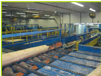
Usine de première transformation Clermond Hamel Itée

On y trouve aussi des usines de première, de deuxième et de troisième transformation. Ce sont les scieries, ou usines de première transformation, qui sont cependant les plus nombreuses. On en compte en effet 164 qui fournissent à elles seules 42 % des emplois dans l'industrie du bois. Les 49 usines de deuxième et de troisième transformation fabriquent des produits finis avec le bois, que ce soit les bois d'apparence (meubles, portes, fenêtres, planchers, armoires et escaliers) ou les bois structuraux (maisons préfabriquées et maisons modulaires). Plus de 90 % du bois transformé dans ces usines provient des résineux, les essences les plus communes étant le sapin, l'épinette, le pin gris et le mélèze. Les autres 10 % proviennent des feuillus, le plus souvent des peupliers.