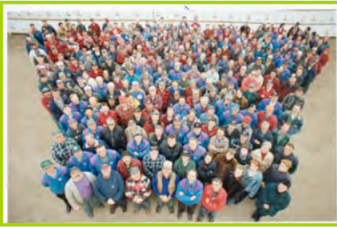
Les Industries Maibec inc. situées à St-Pamphile et St-Théophile : municipalités mono-industrielles

En Chaudière-Appalaches, le secteur forestier occupe une place prédominante dans l'économie régionale. Ce secteur comprend l'aménagement forestier, les services forestiers et la transformation du bois. Avec les scieries et les usines de deuxième et troisième transformation, c'est l'économie de la transformation du bois qui est la plus dynamique dans la région.